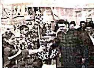
मुख्यमंत्री देवेंद्र फडणवीस यांनी आज महाराष्ट्र उत्पादनांची पाहणी केली आणि स्टॉलधारकांशी संवाद केला. त्यावेळी त्यांनी महाराष्ट्र उत्पादनांची पाहणी केली आणि स्टॉलधारकांशी संवाद केला.

मुंबई, दि. १५ - मुख्यमंत्री देवेंद्र फडणवीस यांनी आज महाराष्ट्र दालजला भेट देण्यासाठी मुंबई येथील स्टॉलधारकांशी संवाद केला. यावेळी त्यांनी महाराष्ट्र उत्पादनांची पाहणी केली आणि स्टॉलधारकांशी संवाद केला. त्यावेळी त्यांनी महाराष्ट्र उत्पादनांची पाहणी केली आणि स्टॉलधारकांशी संवाद केला.